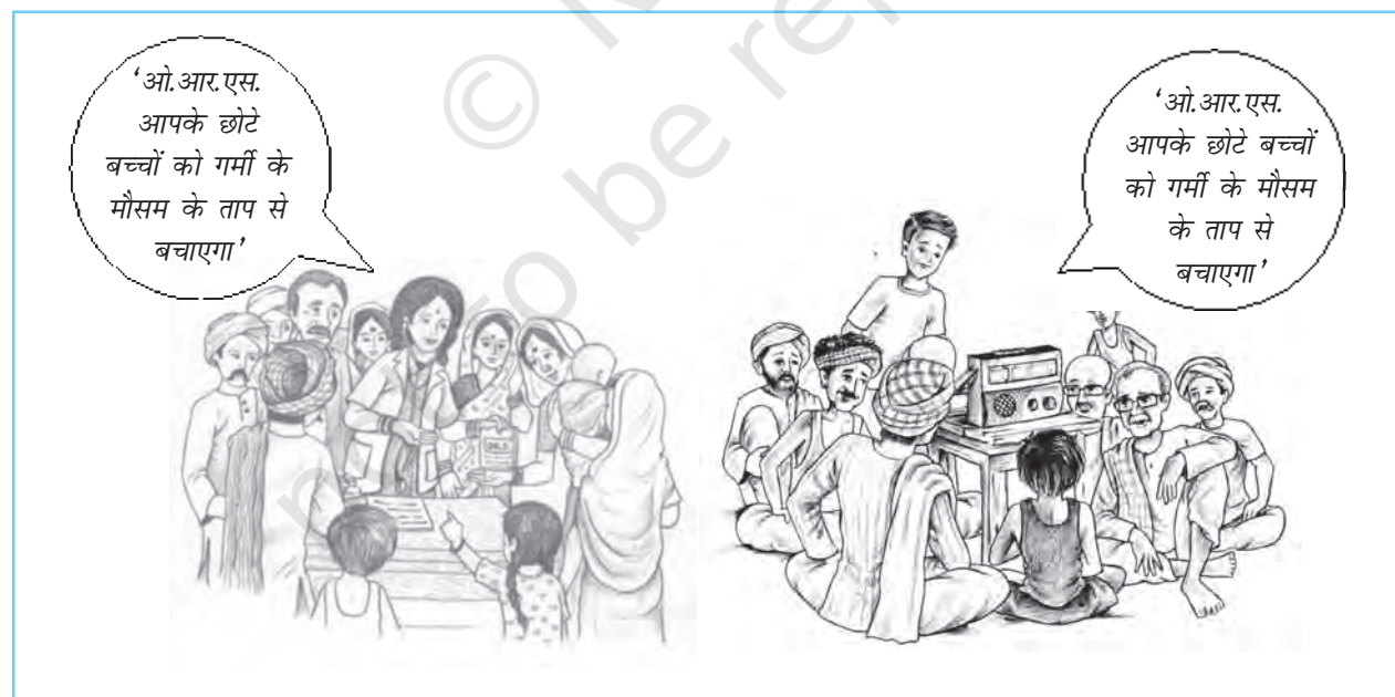
चित्र 6.3 आमने-सामने की अंतःक्रिया बनाम संचार-माध्यम का प्रसारण। कौन बेहतर कार्य करता है? क्यों?

● लक्ष्य की विशेषताएँ – लक्ष्य के गुण, जैसे अनुनयता (persuasibility) , प्रबल पूर्वाग्रह (strong prejudices) , आत्म-सम्मान (self-esteem) , और बुद्धि (intelligence) अभिवृत्ति परिवर्तन की संभावना एवं विस्तार को प्रभावित करते हैं। वे लोग जिनका व्यक्तित्व अधिक खुला एवं लचीला होता है, आसानी से परिवर्तित हो जाते हैं। विज्ञापनकर्ता ऐसे लोगों से अधिक लाभान्वित होते हैं। कम प्रबल पूर्वाग्रह वाले लोगों की तुलना में प्रबल पूर्वाग्रह रखने वाले अभिवृत्ति परिवर्तन के लिए कम प्रवण होते हैं। उच्च आत्म-सम्मान वालों की तुलना में वैसे लोग जिनमें आत्म-सम्मान की कमी होती है और जिनमें पर्याप्त आत्म-विश्वास नहीं होता है अपनी अभिवृत्तियों में आसानी से परिवर्तन कर लेते हैं। कम बुद्धि वाले लोगों की तुलना में अधिक बुद्धिमान व्यक्तियों में अभिवृत्ति परिवर्तन की संभावना कम होती है। हालाँकि, कभी-कभी अधिक बुद्धिमान व्यक्ति कम बुद्धि वाले व्यक्तियों